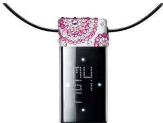
スパークリングピーチ