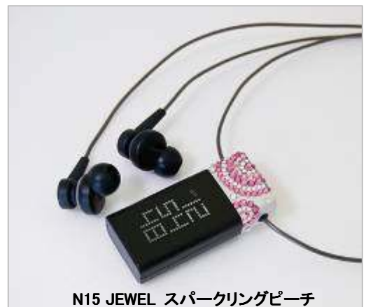
N15 JEWEL スパークリングピーチ

N15 JEWEL は、サウンド専門会社とともに長い時間をかけて開発した、IESE™(アイリバー エクストリーム サウンド エンジン)が、初めて搭載された製品です。IESE™は、専門 Hi-Fi オーディオ製品のように広いサウンド領域を効果的に分離して鮮明な高音から深みのある低音まで原音に近い音を忠実に再現します。また、カナル型イヤホンを採用することにより、耳にしっかりとフィットして装着時の違和感や音漏れを防ぎます