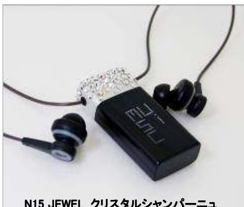
N15 JEWEL クリスタルシャンパーニュ