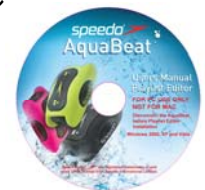
プレイリスト編集ソフト