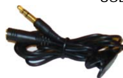
イヤホン延長 ケーブル