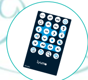
ワイヤレスリモコン付属